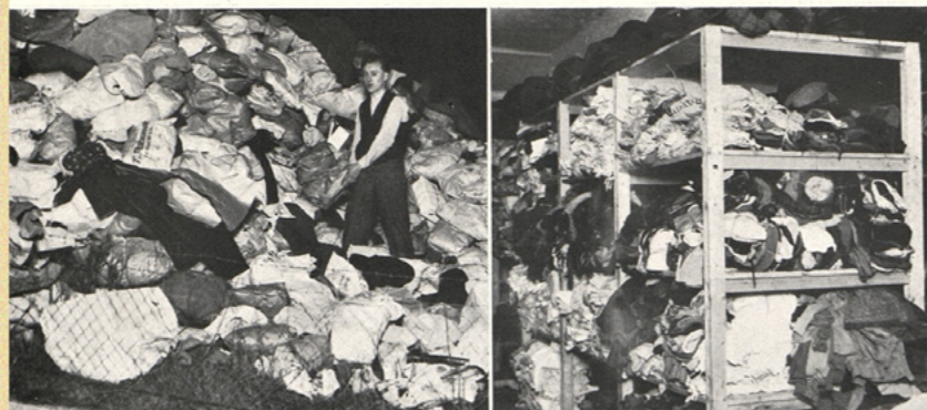
Na pravém břehu Vltavy sebráno 43.000 balíků: Před roztříděním na dvoře vysočan. noclehárny. — Roztříděné připraveno k desinfekci.