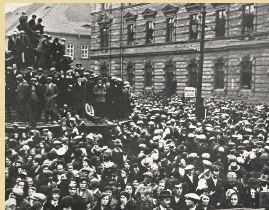
Vážné události v českých uhelných oblastech: Jeden z táborů uspořádaných stávkujícími horníky v Mostě.