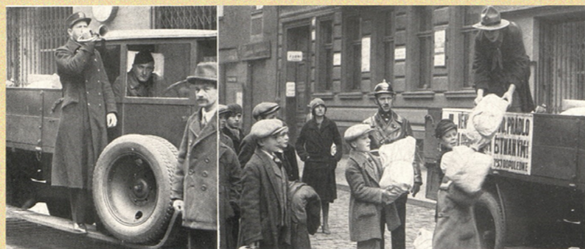
Sběrací akce Červeného kříže v Praze. Na levém břehu vltavském bylo sebráno 15.000 balíků se šatstvem a několik tisíc Kč.