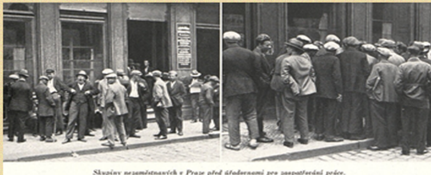
Skupiny nezaměstnaných v Praze před úřadovny pro zaměstnání práce.

Kvůli propouštění vzrostla nezaměstnanost.