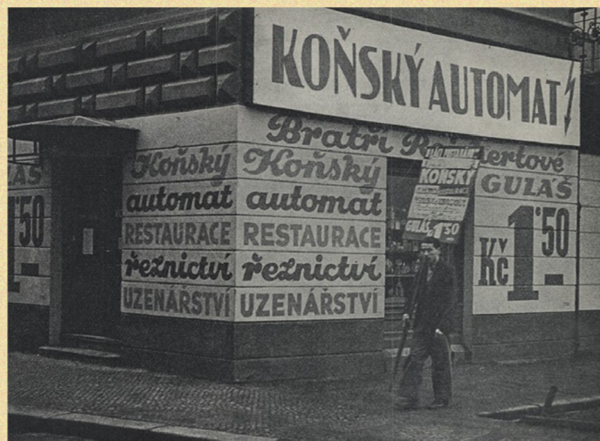
Poslední pražská novinka: koňský automat. Není to automat pro koně, nýbrž pro lidi, kteří se tu mohou laciněji než v kterémkoliv jiném automatu nasytit — lahůdkami z koniny. Vlevo vidíte, jak se lahůdky připravují, nahoře exteriér nového podniku.