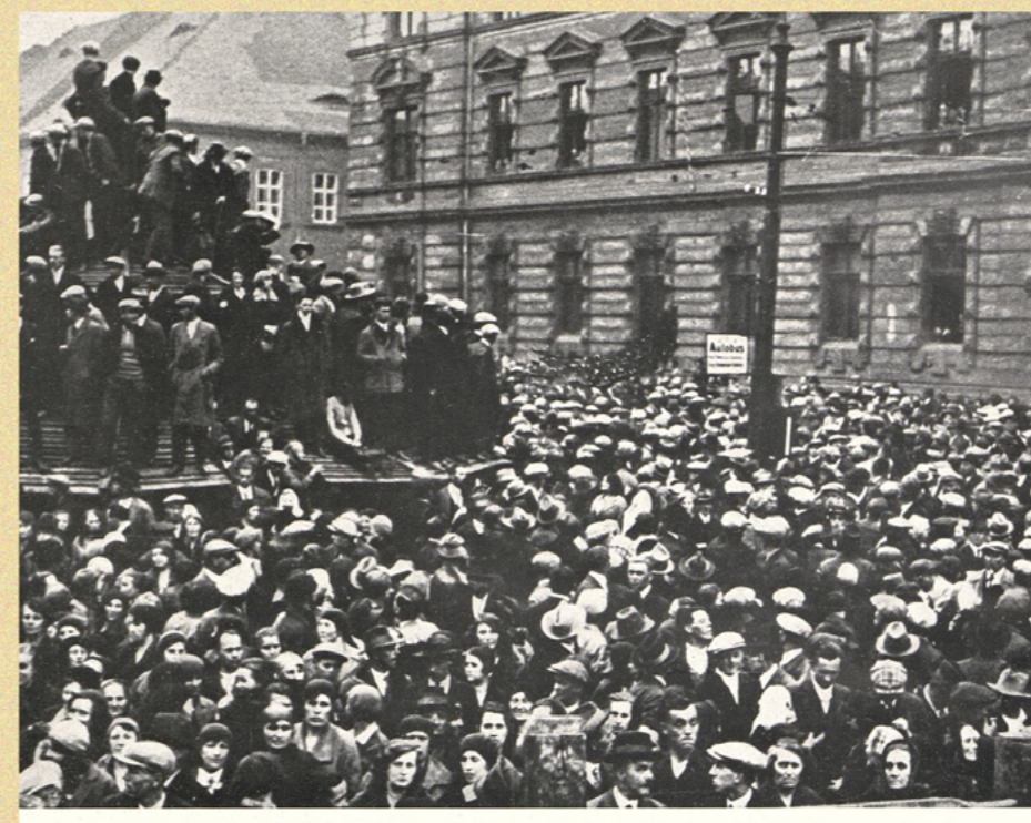
Vážné události v českých uhelných oblastech: Jeden z táborů uspořádaných stávkujícími horníky v Mostě.