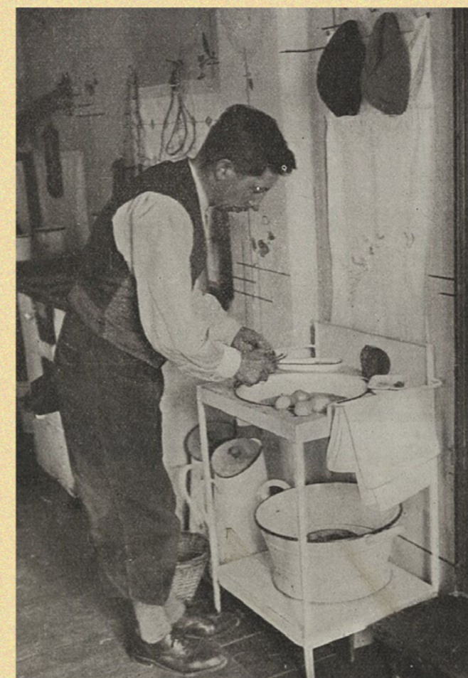
Škrabat brambory nás naučili na vojně — teď se to hodí.